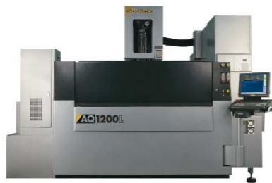
■ Sodick AQ1200L

Az AQ1200L nagy méretű huzalos szikraforgácsoló gép a turbínagyártás és repülőgépipar számára kínál egyedülálló megoldásokat.