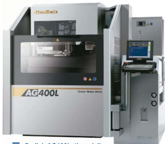
Sodick AG400L új modell

IC-Hungary Kft. 2310 Szigetszentmiklós, Ozsvári út 2/B Tel.: 06-24-444-230 Fax: 06-24-444-231